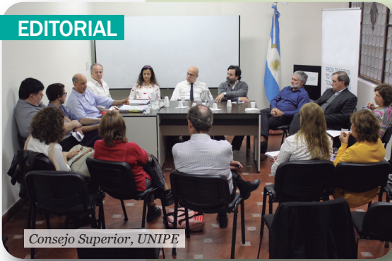
Consejo Superior, UNIPE