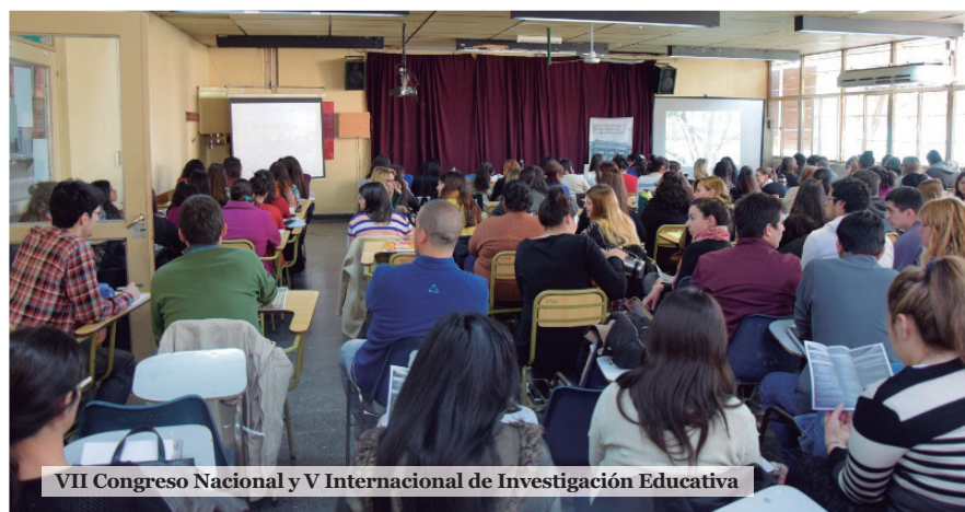
VII Congreso Nacional y V Internacional de Investigación Educativa

Los días 18 y 20 de abril se realizó en la Facultad de Ciencias de la Educación de la Universidad del Comahue, el VII Congreso Nacional y V Internacional de Investigación Educativa. Bajo el título “Políticas y prácticas de producción y circulación del conocimiento” .