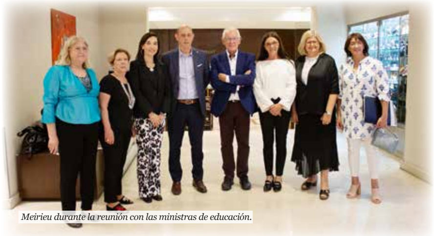
Meirieu durante la reunión con las ministras de educación.

Seguramente uno de sus mayores aportes radica en ese modo de pensar que permite poner en relación los debates más generales acerca de