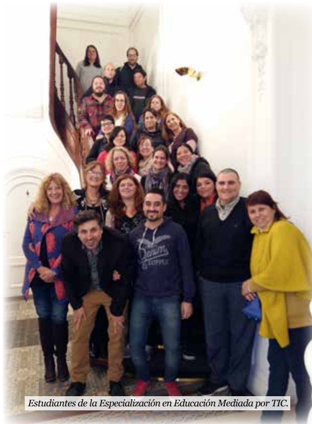
Estudiantes de la Especialización en Educación Mediada por TIC.

La Especialización constituye una propuesta académica orientada a la formación de docentes especializados en la indagación, el diseño, el desarrollo y la evaluación de itinerarios y ambientes enriquecidos con tecnología que pueden potenciar y generar