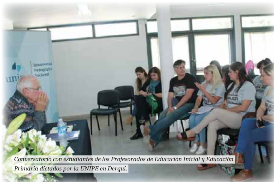
Conversatorio con estudiantes de los Profesorados de Educación Inicial y Educación Primaria dictados por la UNIPE en Derqui.

En fin, mas de 6000 docentes se acercaron de múltiples modos a Meirieu en este día que organizó UNIPE. Lo escucharon, le y se preguntaron, le discutieron, le contaron la situación argentina actual. En tiempos de tecnocracia y emprendedurismo, de desconocimiento y vaciamiento de la escuela pública, de cálculos infinitesimales, Meirieu puso sobre la mesa generosamente palabras pedagógicas, cargó sentidos para la tarea de enseñar, valorizó el día a día escolar, aportó a fortalecer tramas.