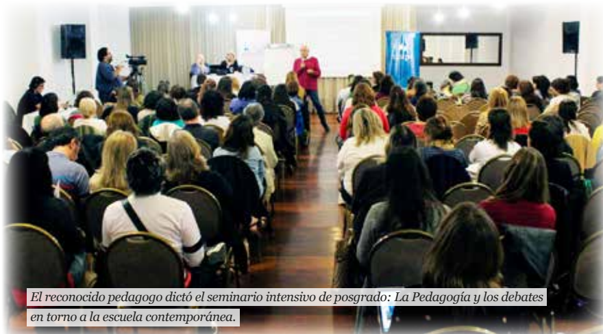
El reconocido pedagogo dictó el seminario intensivo de posgrado: La Pedagogía y los debates en torno a la escuela contemporánea.

UEPC, el gremio docente de esa provincia. Dio una conferencia en la FFyL de la UBA ante más de 500 estudiantes de los ISFDs de CABA y de la Facultad, donde se quedó hasta las 23 horas en un intercambio mas íntimo con los y las estudiantes de la Cátedra "Formación y Reciclaje docente". Fue invitado a la Cooperativa de Educadores e Investigadores Populares (CEIP) la que desarrolla la Escuela de Formación de Formadores "Dora Barrancos" y algunos de los profesorados en educación popular (en Biología, en Historia, en Lengua y Literatura) que forman parte de la Universidad de los Trabajadores-IMP: allí conoció le presentaron la experiencia y dialogó con más de 30 profesores que la llevan adelante.