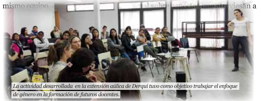
La actividad desarrollada en la extensión áulica de Derqui tuvo como objetivo trabajar el enfoque de género en la formación de futuros docentes.