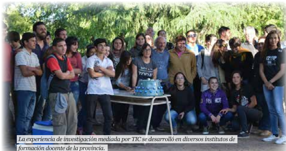
La experiencia de investigación mediada por TIC se desarrolló en diversos institutos de formación docente de la provincia.

La propuesta está orientada a recorrer y analizar los problemas de la práctica docente percibidos por los propios profesores. De ésta forma, se intenta construir un andamiaje didáctico que incorpore los saberes profesionales de cada docente participante, los aportes de cada línea teórica, (principalmente los relacionados con los problemas ya estudiados por el grupo de la UNIPE) tales como: aportes a la integración entre las diversas disciplinas y tecnologías en la resolución de problemas 3 , la integración de TIC 4 , implementación de actividades experimentales abiertas 5 que incorporen entornos de desarrollo de hardware y software abierto, tales como la plataforma ARDUINO.