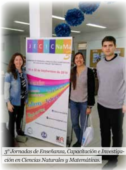
3° Jornadas de Enseñanza, Capacitación e Investigación en Ciencias Naturales y Matemáticas.

De este modo, la secuencia analizada permite reflexionar sobre el lugar del docente y de los estudiantes en la elaboración de teoría, poniendo el foco en algunos aspectos que hacen a la tarea docente: las anticipaciones, el rol de las intervenciones, las discusiones que se habilitan en el aula, los intercambios que se propician y la gestión de la clase.