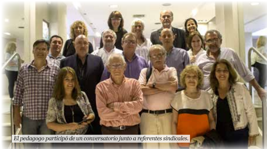
El pedagogo participó de un conversatorio junto a referentes sindicales.

Las actividades de Meirieu fueron muchísimas: hizo la conferencia de apertura del 1er Congreso Internacional “Educación e Inclusión desde el Sur”, en Río Grande ante 3200 docentes; trabajó en talleres con el conjunto del equipo docente de la Escuela Víctor Mercante de Villa María, cerró el Seminario “Frankenstein vs. Meirieu: ¿por qué en tiempos de digitalización de la cultura es necesaria una pedagogía contra la fabricación?” que desarrolló el ISEP (Instituto Superior de Estudios Pedagógicos) de Córdoba. En un acto muy emotivo, Philippe Meirieu conversó sobre Pedagogía y Política y fue nombrado primer socio honorario de la