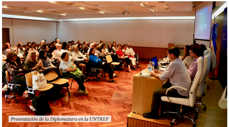
Presentación de la Diplomatura en la UNTREF

Como marco de este lanzamiento, se desarrolló un panel titulado "PISA 2018: resultados, interpretaciones y controversias" con el objetivo de debatir la reciente publicación de los resultados PISA, uno de los principales operativos de tipo cuantitativo desti-