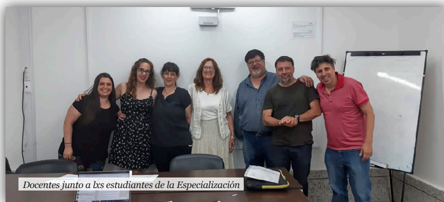
Docentes junto a lxs estudiantes de la Especialización

El trabajo final o Proyecto Integrador, que pertenece al eje de la Formación Práctica, constituye un espacio estratégico de convergencia y de confluencia de los saberes, las competencias y las prácticas que cada uno de los participantes fue construyendo y resignificando a lo largo de la Especialización.