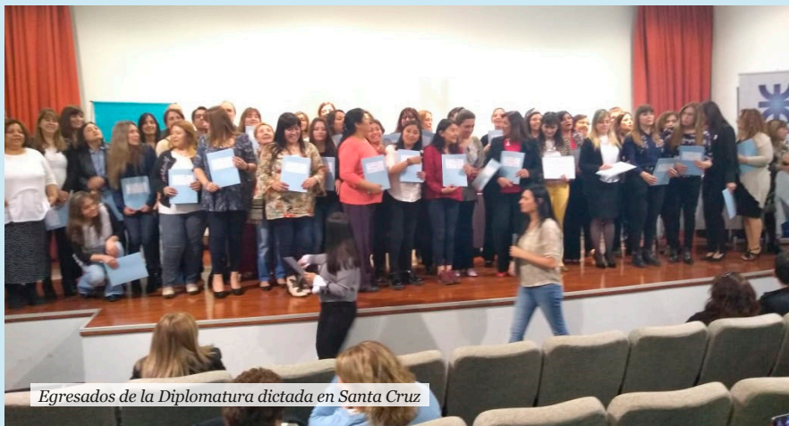
Egresados de la Diplomatura dictada en Santa Cruz

En el marco de la Diplomatura en Políticas Educativas de la UNIPE que se desarrolla desde el 2018 en Santa Cruz en acuerdo con el Consejo Provincial de Educación en las sedes de Caleta Olivia y Río Gallegos, el día 5 de diciembre se hizo la primer entrega de diplomas a los 120 egresados. Desde el inicio del dictado de la Diplomatura transitaron dos cohortes con un total de 240 docentes y directivos de los diferentes niveles educativos.