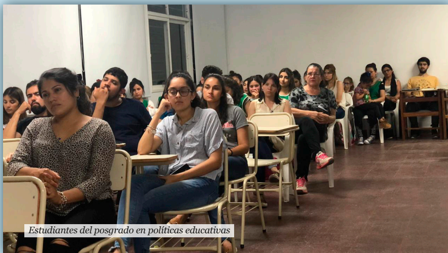
Estudiantes del posgrado en políticas educativas

En esta oportunidad, se han abordado múltiples autores del campo intelectual de la educación, trabajando la relación entre “Políticas y Desigualdad Educativa” y coordinados, además, por la experticia de los disertantes, junto a un grupo de 80 docentes quienes estuvieron atentos y motivados ante la excelencia de la propuesta.