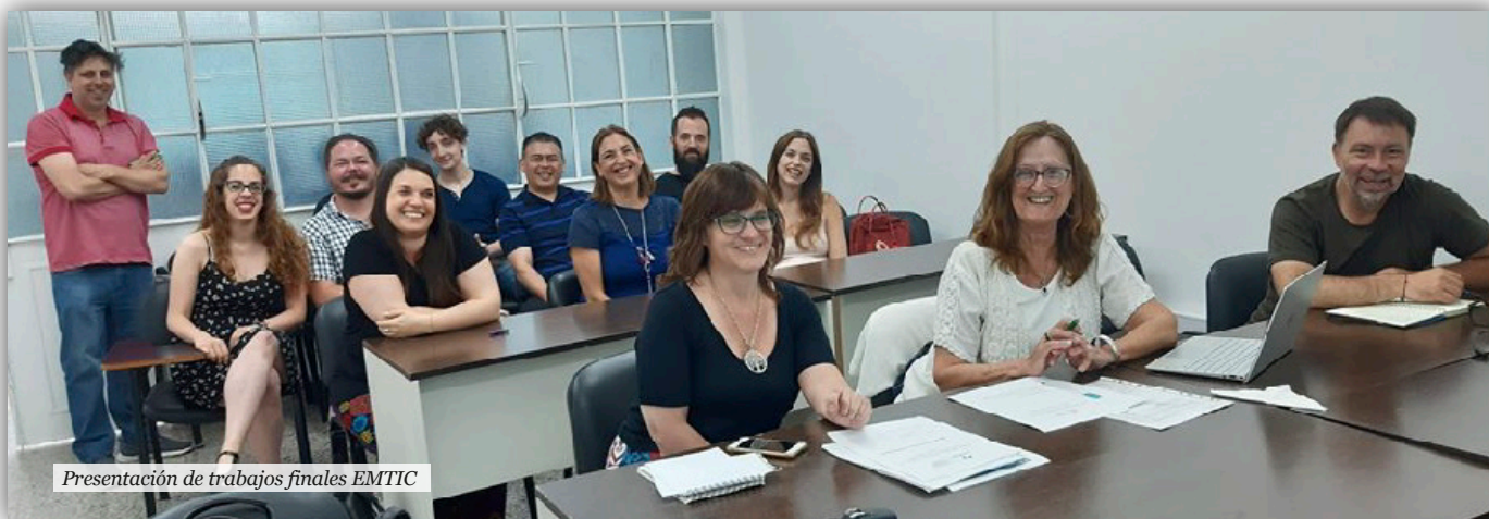
Presentación de trabajos finales EMTIC

Una educación que promueva la inclusión tecnológica, que reconozca los nuevos saberes digitales, en fun-