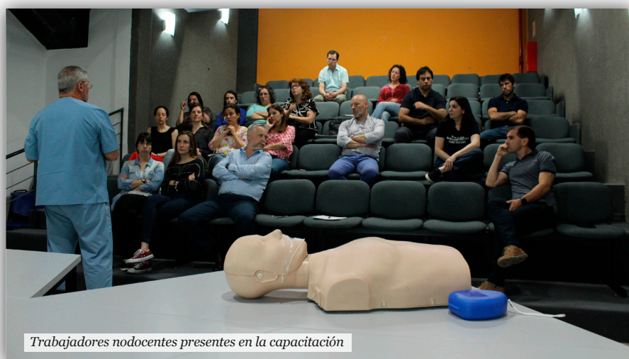
Trabajadores nodocentes presentes en la capacitación

Asistieron más de 50 estudiantes de los Profesorados de enseñanza Primaria e Inicial, y 30 trabajadores nodocentes. Se trabajó sobre el concepto de alimentación saludable, identificando los distintos grupos de alimentos, su composición nutricional y las funciones de los nutrientes en el organismo.