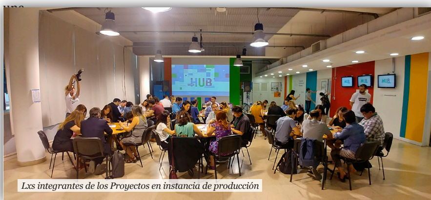
Lxs integrantes de los Proyectos en instancia de producción

Esta iniciativa, que está pensada para ser aplicada con estudiantes del primer ciclo de la escuela secundaria, se propone explorar, diseñar y prototipar proyectos de tecnología aplicados a la educación, incluyendo una instancia formativa y un documento que recopile acciones que puedan servir de inspiración para otros colegas y contextos educativos. En breve, el resultado de este proyecto será público para toda la comunidad docente, y consistirá en un libro digital y