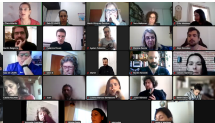
La capacitación contó con instancias presenciales y virtuales