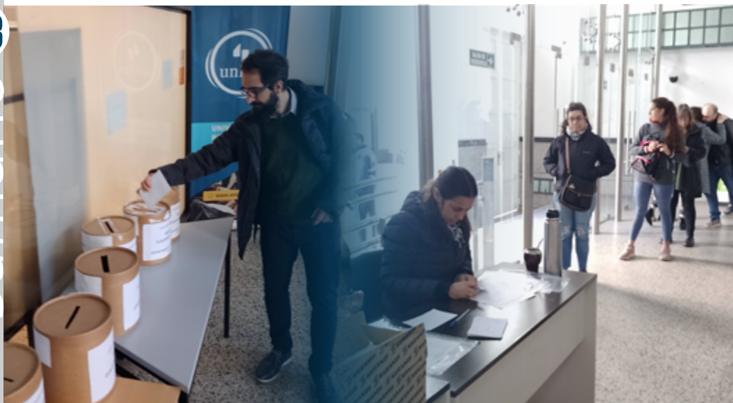
La jornada de elecciones contó con una amplia participación de los claustros