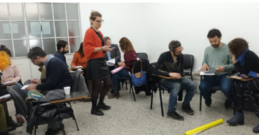
Esta etapa del ciclo estuvo destinada a los/as docentes de los tres departamentos pedagógicos