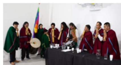
Durante la ceremonia se llevó adelante un espacio artístico en el que participaron, docentes, estudiantes y autoridades.