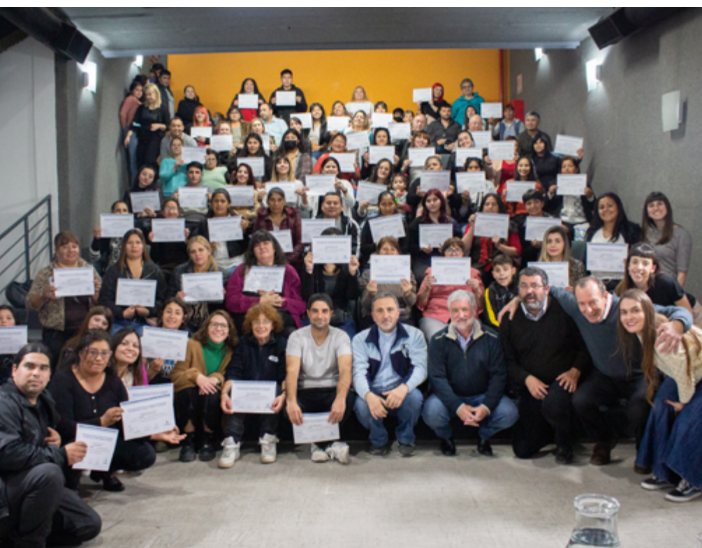
Egresados/as del curso

Durante el encuentro también hubo lugar para un espacio artístico intercultural, el espacio a.c. Comunidad Inalmama Wiñaypaj del Movimiento Plurinacional de Trabajadores de Abiyala M.I.P.T.A, desarrolló una presentación en la que participaron, estudiantes, docentes y autoridades, quienes compartieron y fraternizaron dentro de las visiones emergentes de la educación popular.