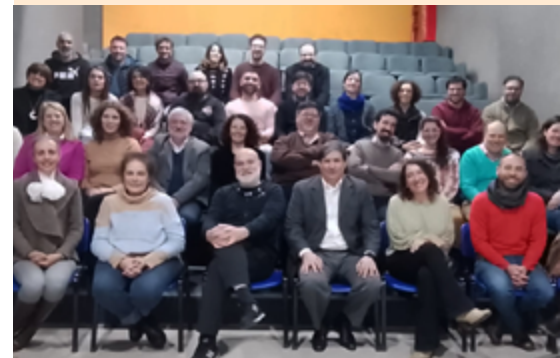
Los/as candidatos/as a representantes de los claustros docentes y nodocentes de la lista

La reunión se desarrolló con un diálogo e intercambio sobre los ejes fundamentales para el fortalecimiento del proyecto universitario en el período 2022-2025 que incluye despliegue de las sedes metropolitana y bonaerense, la implementación de la carrera docente y las perspectivas vinculadas a los proyectos de investigación y transferencia.