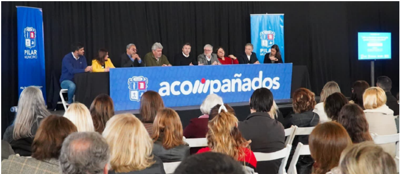
La comunidad educativo participó del encuentro desarrollo en Pilar.