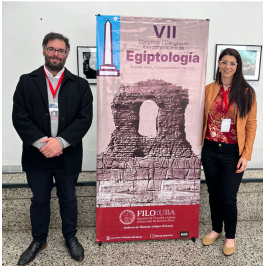
El encuentro tuvo lugar en la Sede de la UNIPE entre los días 5 y 7 de septiembre de 2022.

Participaron del mismo, el comité organizador, junto a docentes y estudiantes de las carreras del profesorado y licenciatura en Historia de la UNIPE. Esta fue la primera vez que el Congreso se realizó fuera del viejo mundo, honrando así el gesto generoso y fraternal de los organizadores de su última edición, quienes propusieron la modificación en la denominación del evento, de Ibérico a Iberoamericano. Si el VI Congreso fue –en palabras de sus gestores– el cierre de un ciclo, con el retorno a Madrid donde todo había comenzado veinte años antes, tenemos grandes expectativas de estar a las puertas de un nuevo y más amplio ciclo. Y si en el transcurso de aquel, la Egiptología hispano-lusa fue alcanzando una robustez que actualmente la asemeja a la practicada en los centros más importantes a nivel mundial, este ciclo tiene el propósito de representar la expansión de esos estándares de calidad a la escala de la vasta comunidad iberoamericana.